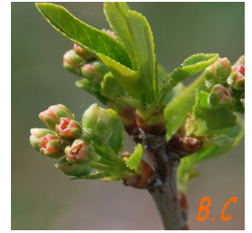
Les bourgeons au printemps