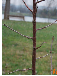
Les bourgeons en hiver