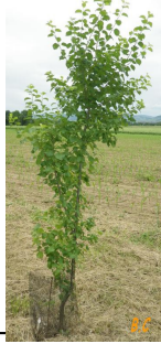
Le port du végétal