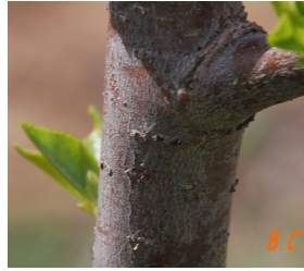
Tronc montrant l'écorce