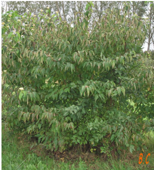
Le port du végétal