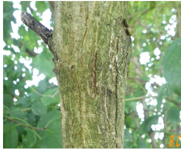
Le tronc montrant l'écorce