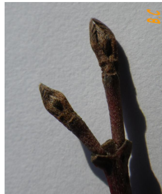
Bourgeon en hiver