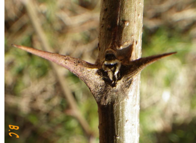
Bourgeons en hiver