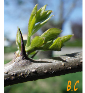
Bourgeons au printemps