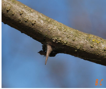
L'écorce du tronc

Photographie sur le port du végétal (= allure générale)