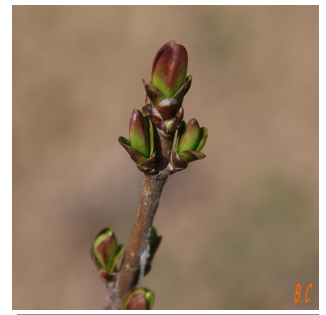
Les bourgeons au printemps