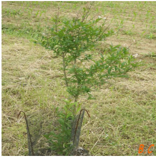
Port du végétal