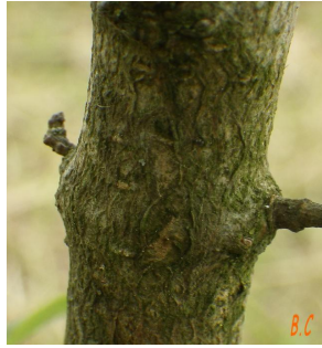
L'écorce de tronc du troène