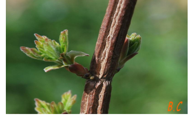
Les bourgeons au printemps