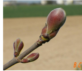
Les bourgeons en hiver