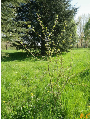
Port du végétal