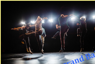
Danse: Le grand Bal

Théâtre en immersion dans une salle de classe suivi d'un débat sur le thème des migrants (classes de 4 e 5 et 4 e 6)